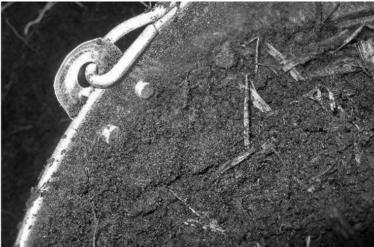
Рис. 2. Отличительные черты перепревшего навоза — темный цвет и рассыпчатость. Он уже не похож на свежий навоз и не имеет его запаха. Здесь совсем другие вещества

И все же вернемся к теме главы: мы с вами будем работать не с навозом, а с компостом! Нас интересуют не столько способы хранения навоза, сколько способы компостирования различных доступных органических веществ, при которых компост по питательности становится равен навозу.