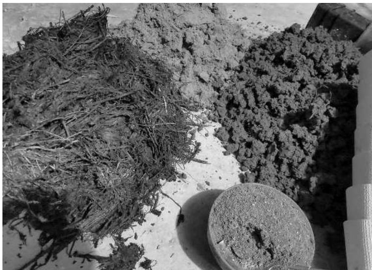
Рис. 3. 2–3-годовалый лиственный или травяной перегной внешне сильно похож на перегной навозный, с той разницей, что крошево у него мельче. Питательность же их для растений можно считать одинаковой. Необходимо учитывать, что как навозный, так и травяной перегной имеет долгую выдержку, следовательно, за годы сильно промылся дождями и талой водой и обеднел на какие-то податливые к миграции элементы, например калий

Разлагать органику могут разные микроорганизмы — аэробные (кислородные) и анаэробные (бескислородные). Мы можем использовать и тех и других в зависимости от цели. Например, хорошую жидкую подкормку — травяное удобрение, которое по питательности приравнивается к навозной жиже, мы получаем с помощью анаэробных микроорганизмов, а классический рассыпчатый компост для весеннего удобрения почвы — с помощью аэробных. Качество питания для растений в обоих случаях зависит от того, чем вы